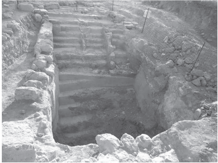
איור 6: תל חברון: המקווה המזרחי; מבט מדרום-מערב.

הרגל הרבים שהגיעו למערת המכפלה הסמוכה. יש כמה קווי דמיון בין האתר בקומראן לממצא בתל חברון מעבר לברכות המדרגות הגדולות שבהן גרם מדרגות משולש, שחלק מהחוקרים מפרשים אותן כמקוואות ציבוריים - השימוש הנרחב בתעלות מים ארוכות העוברות מתחת לרצפות או באזורים אחרים ומשמשות לניקוז מי הגשמים ולאגירתם בכמה ברכות ובורות מים, וכן הימצאות מתקנים לייצור כלי חרס בקרבת מקום.