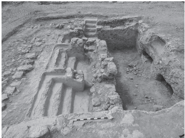
איור 7: תל חברון: המקווה המערבי בדרום-מערב תל חברון; מבט מצפון- מזרח. במרכז נראה קיר מהתקופה הרומית המאוחרת המבטל את המדרגות.