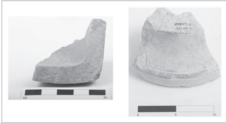
אזור 8: שברי כלי אבן גיר מתל חברון.