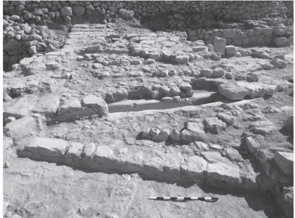
איור 2: תל חברון: הרחוב המדורג מימי בית שני בשטח העליון, מבט מדרום.