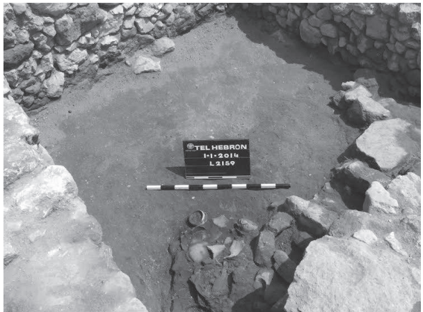
איור 3: תל חברון: חדר מטבח עם כלים על הרצפה השרופה, מבט מדרום (צילום: דוד בן-שלמה).