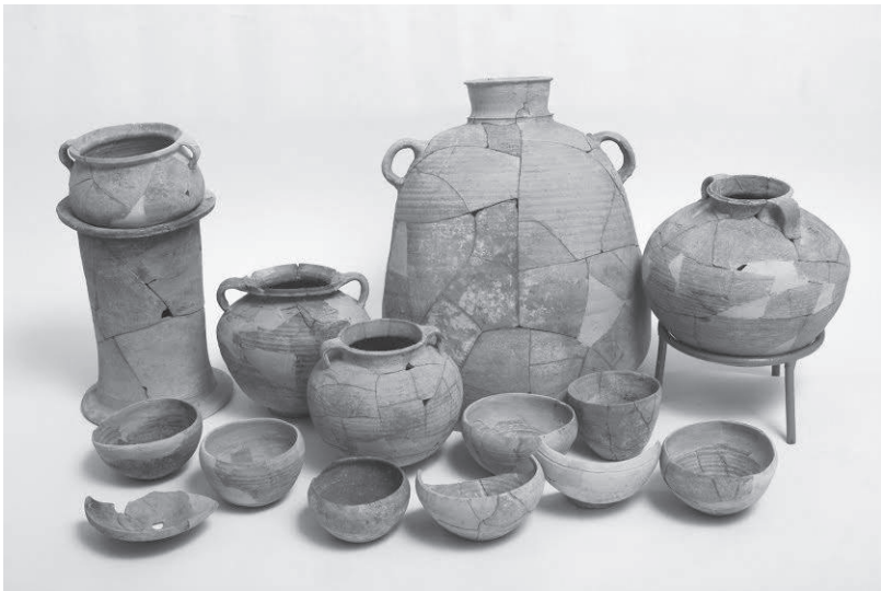
איור 4: מכלול כלים מרופאים מחדר המטבח.

המאוחר ביותר בתקופה, שלב 3). ממערב לגרם המדרגות נחפר מבנה שלם יותר, הכולל לפחות ארבעה חדרים, אולם רוב קירותיו החיצוניים לא נשתמרו עקב בניית השלב הסופי של ימי בית שני. נראה כי הבית נבנה בצמוד לרחוב המדורג ועל שפתה הצפונית של ברכת המקווה. המבנה כולל חדר קטן או מסדרון עם פתח לכיוון גרם המדרגות (רצפת חדר זה לא השתמרה). בסמוך אליו היה חדר קטן, שגודלו 2.5 \times 2.5 מ' לערך, וירדו אליו בשלוש מדרגות (חדר 2159). החדר, שהיה כנראה המטבח של הבית, השתמר בשלמותו עם שכבת שרפה וממצא של כלים שלמים: 14 קערות ושברי קערות רבים, שלושה סירי בישול בכל מיני גדלים, כן גלילי, קדרת בישול, פך ובו גרעיני זיתים שרופים, פכית וכן שברי כלי חרס רבים. במפלס הגבוה יותר נמצאו קנקנים מספר, אולם אף לא אחד מהם רופא בשלמותו. תקרת החדר הייתה כנראה מעץ, שכן על הרצפה נמצאו כמה מסמרי ברזל גדולים; נראה כי מעליו הייתה רצפת הקומה העליונה של המבנה - ועליה היו הקנקנים. בפתח החדר נמצא גם מפתח ארכובה גדול מברזל, שנותר כנראה בחור המנעול של הדלת שנסרפה. חדר נוסף בדרום המבנה נשתמר בחלקו עקב בנייה מאוחרת, ונחפרה בו שכבת רצפה ואבנים ממוזות הדלת. שכבת אפר שחור נתגלתה גם על הרצפה שממערב למבנה, ונראה שסיום שלב זה באתר, שלווה בהרס בשרפה, קשור להרס העיר בידי אספסיאנוס בשנת 68 או בשנת 69 לספירה, או למעשה בידי קריאליס (Cerialis), מפקד הלגיון החמישי, שפעל תחת פיקודו של אספסיאנוס בימי המרד הגדול.