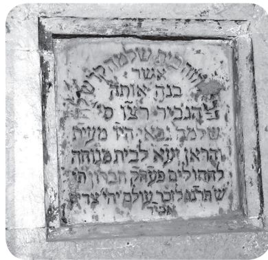
איור 7 - אבן הקדשה המנציחה את תרומת שלמה גבאי מהראן [אוראן] שבאלג'יריה, תרנ"ג. לתיאור התרומה ופיענוח ההקדשה ראו: שרביט, 'ראשית הרפואה', עמ' 92.

עם זאת חברון לא נעדרה כל סממני מערבים. למרות הפעילות המוגבלת של שד"רים מחברון במגרב הגיעו תרומות משם. בשנת תרנ"ג, למשל, הגיעו תרומות נדיבות מיהודים מאלג'יר ומאוראן שבאלג'יריה למימון שירותי בריאות בעיר, ולוחות הקדשה בבניין שלימים נודע כ'בית הדסה' מנציחים את תרומותיהם (ראו איור 6-7). 33