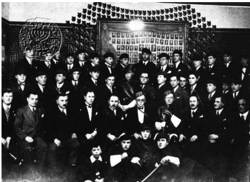
אגודת "חברוניה" עם זאב ז'בוטינסקי, 1926