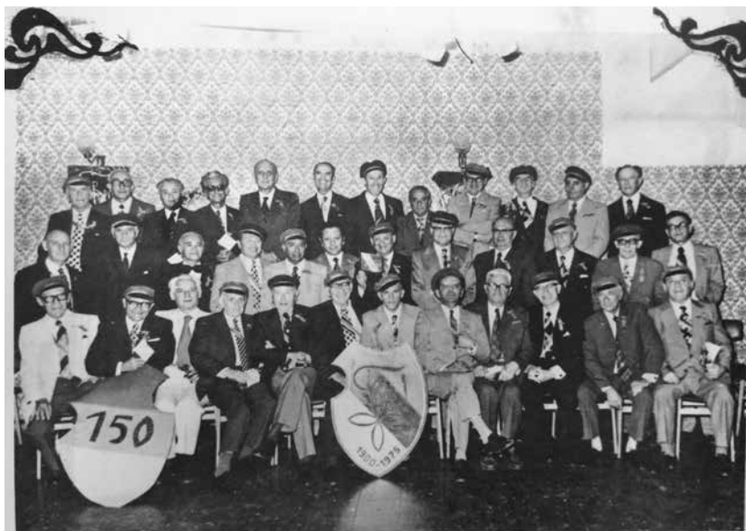
יוצאי "חברוניה" במפגש בארץ בשנת 1975