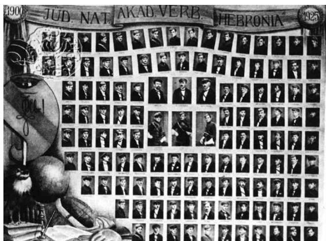
אגודת הסטודנטים חברוניה בשנת 1925