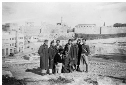
תמונה מס' 3: פלוגה ה' הדרומית ברקע מגדל דוד והחומה. 16 בנובמבר 1943.

מסעות הפלמ"ח לנגב ולמדבר יהודה הם מן המפורסמות. חלק ממחלקותיו ערכו מסעות ארוכים גם בגב ההר כמו במרחב שכם, הר חברון, שפלת יהודה ובקעת הירדן (חרובי ורגב 2017, עמ' 186-187; אלמכיאס 2022). בכתובים ובתצלומים מתקופת המסעות עולה כי היו גם מסעות וסיורים לירושלים. למשל, ברשימת הסיורים של מחלקת הסיירים של פלוגה ה' (הדרומית) מופיעים מספר מסעות שכללו ביקור או סיור בירושלים: א. בחודש ספטמבר 1943: מסע של שלושה ימים מבן שמן, שילתה, בית חורון, גבעון, בית חנינה ונוה יעקב, ירושלים (נסיעה ברכבת), נען וגבעת ברנר. ב. בחודש אפריל 1945: מסע של חמישה ימים מבן שמן, קרית ענבים, צובה, עין כרם, בית צפפה, רמת רחל, ירושלים, שכם (פסח השומרונים בהר גריזים), שועפת ונוה יעקב, מעלה החמישה, סריס ובית מחסיר, מערת התאומים והר טוב. ג. בחודש פברואר 1946 מסע מירושלים לנגב (בית אשל, מעלה עקרבים ועוד), חזרה לירושלים ומשם לבית הערבה. מסעות רבים אחרים יצאו או הסתיימו בירושלים (חכלילי 1987, עמ' 201-203). וראו שם בצירי המסעות שבנספח המפות).