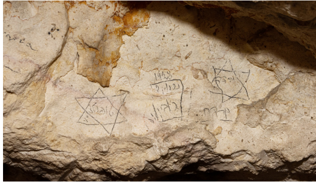
תמונה מס' 1: סמלי מגן דוד על קירות מערת צדקיהו. 1928. צילום: הוהיה סעדיה (פב' 2021)