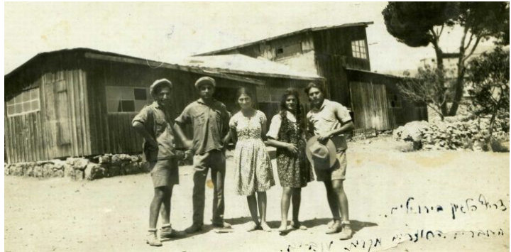
תמונה מס' 2: צריף לגיון הצופים בירושלים 1929 באדיבות: חגי בן גוריון, ארכיון בית השיטה.