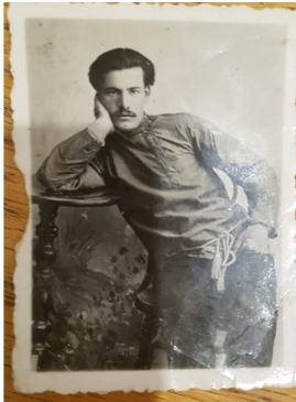
תמונה מס' 6: ישראל בצר בשנת 1904.