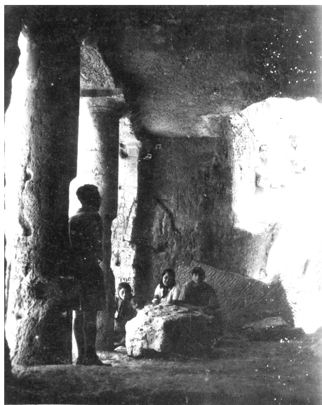
תמונה מס' 4: פלוגה ח' בבית החופשית (קבר בני חייזר) ירושלים. 1944. באדיבות אוצר תמונות הפלמ"ח.

יש יסוד להניח כי סיירי הפלמ"ח ששהו ולמדו על ירושלים, צעדו בעקבות קודמיהם בנתיב האתרים המוכר והידוע בעיר. פרק זה של סיורים ומסעות במסגרת פלוגות הפלמ"ח בירושלים הוא המשך טבעי וישיר לפעילות הנוער ותנועות הנוער בירושלים בתחום זה, בתוספת הצורך המבצעי לחיזוק ירושלים על סמליותה ההיסטורית.